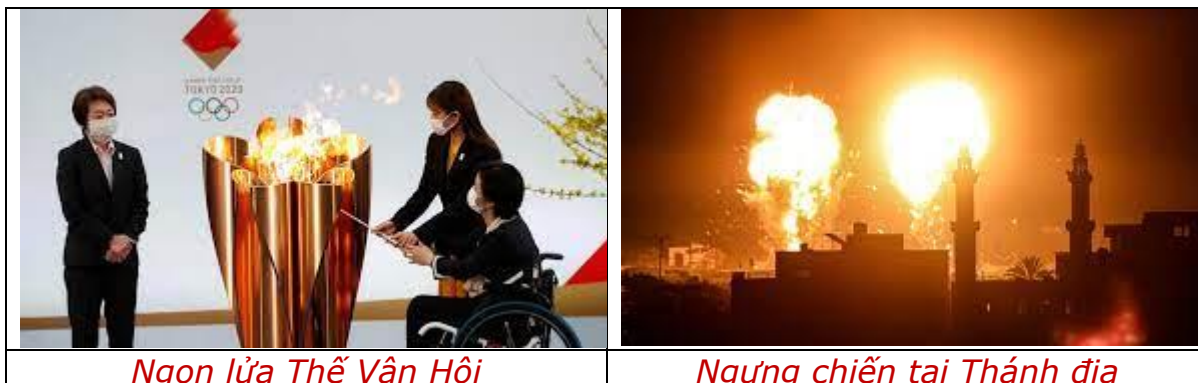
Ngọn lửa Thế Vận Hội